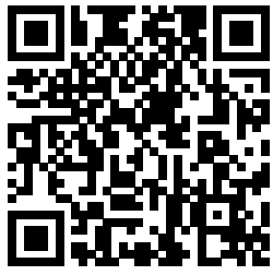
QR کد فرم اطلاعات مهمان و انتقال

ج) تکمیل فرم اطلاعات متقاضیان مهمان و انتقال به نشانی: http://usc.ac.ir/files/1595847745421.pdf