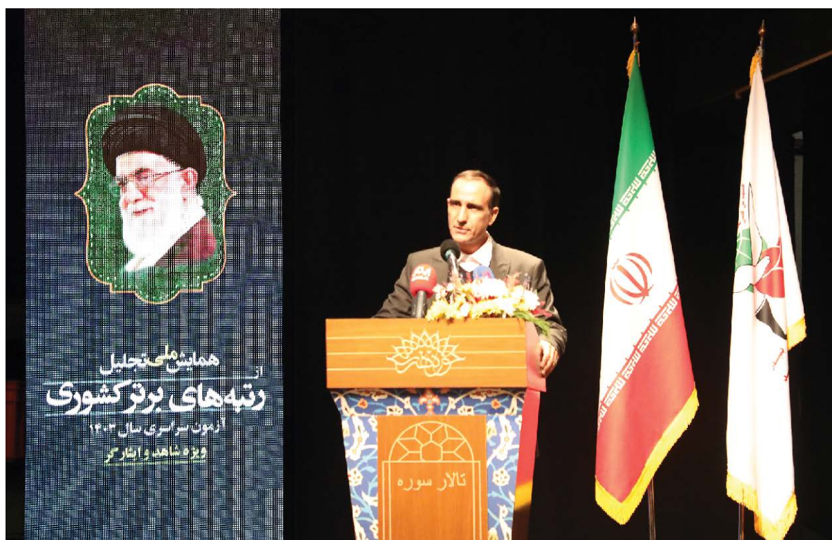
سرپرست سازمان سنجش آموزش کشور خبر داد